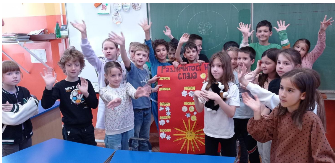
Различитост нас спаја