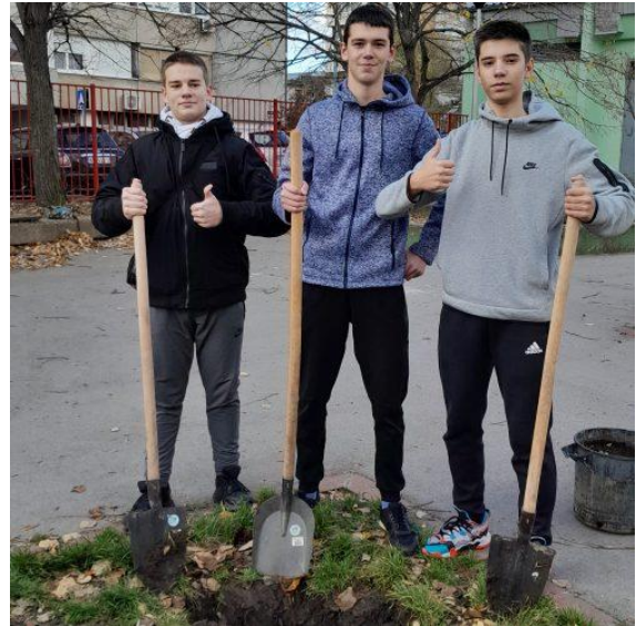
Акција садње дрвећа у школском дворишту