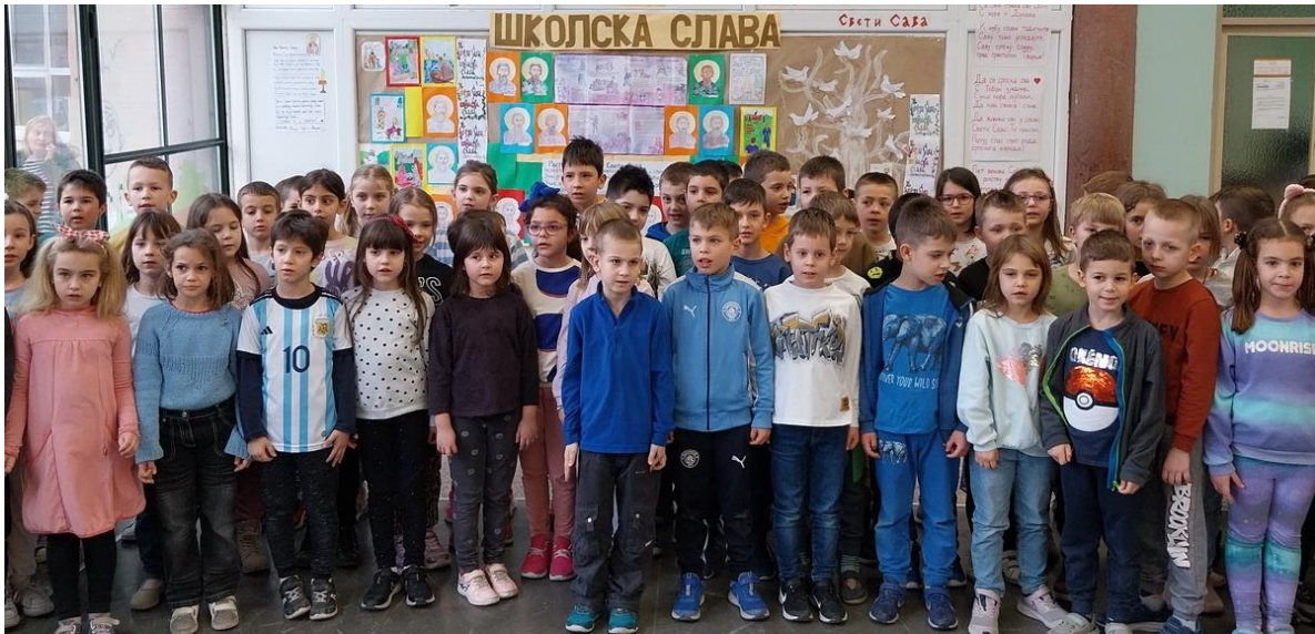
Обележавње школске славе у продуженом боравку

Поводом прославе школске славе, Светог Саве у продуженом боравку наше школе ученици су са својим учитељицама из продуженог боравка поставили заједнички пано о животу нашег просветитеља и уз певање химне Светом Сави обележили овај значајан дан.