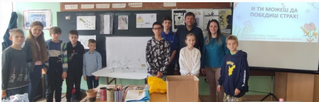
“И ти можеш да победиш страх“