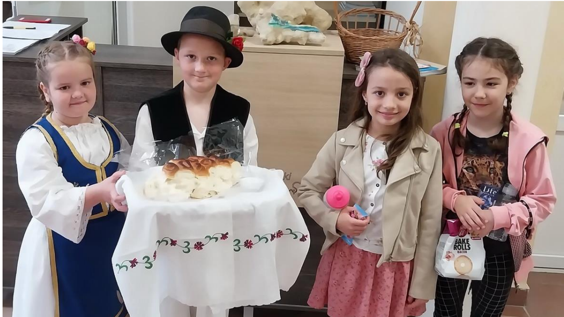
Смотра ћириличке писмености

25.05.2023. Несвакидашњи час руског језика