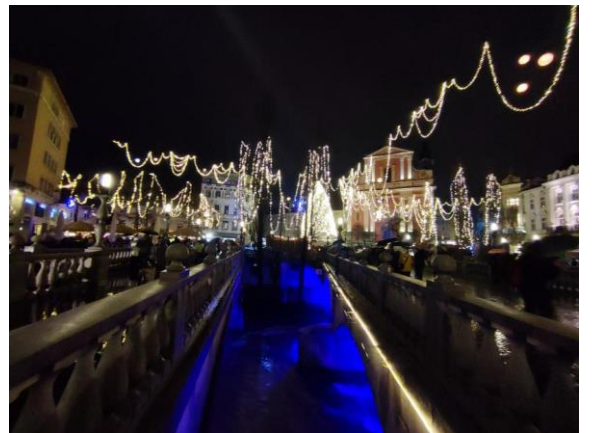
Разгледање центра Љубљане