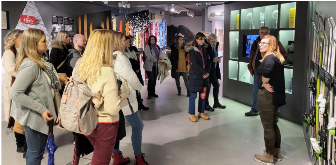
Посета музеју фабрике Елан