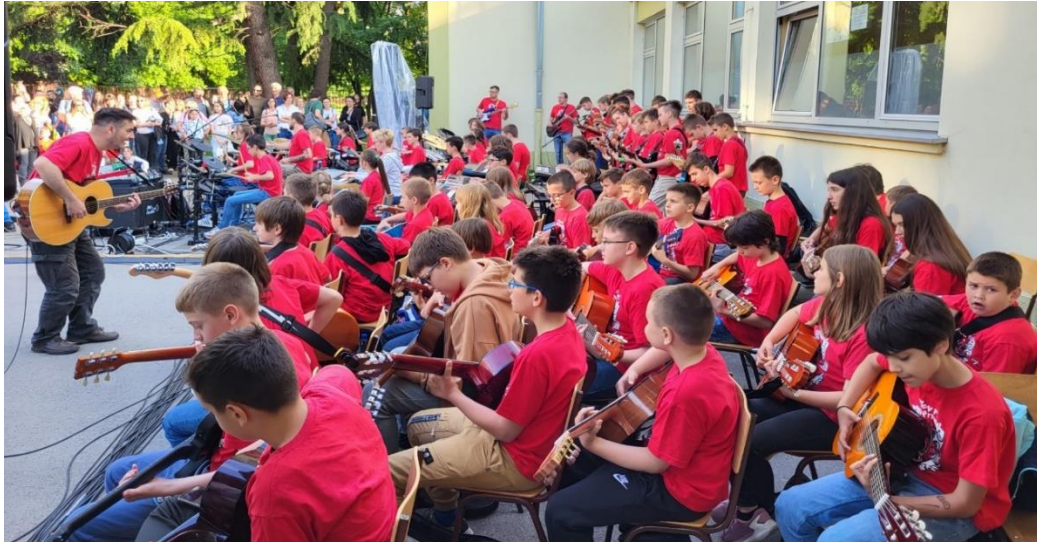
Гитаристи „Креативног М кутка“