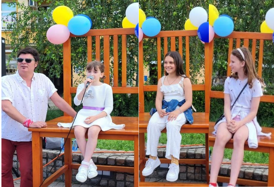
Програм „Овде станују песме“