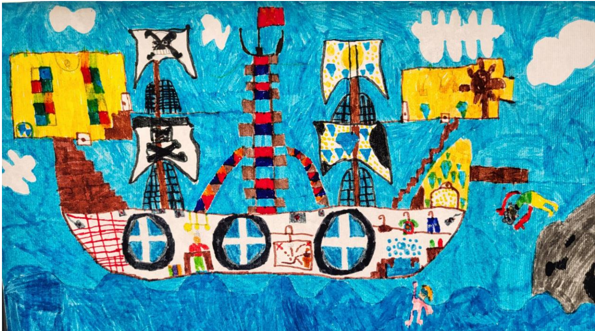
Део изложбе ликовних радова која је организована за Дан школе

20.11.2022. Обележен је Светски дан детета