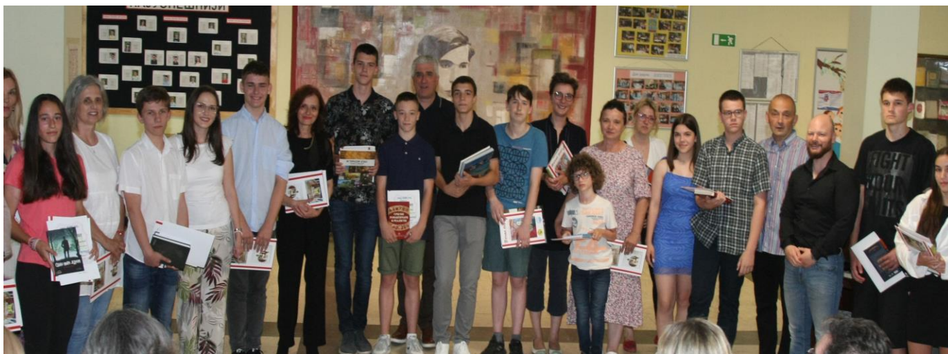
Најуспешнији ученици школске 2022/23. са менторима