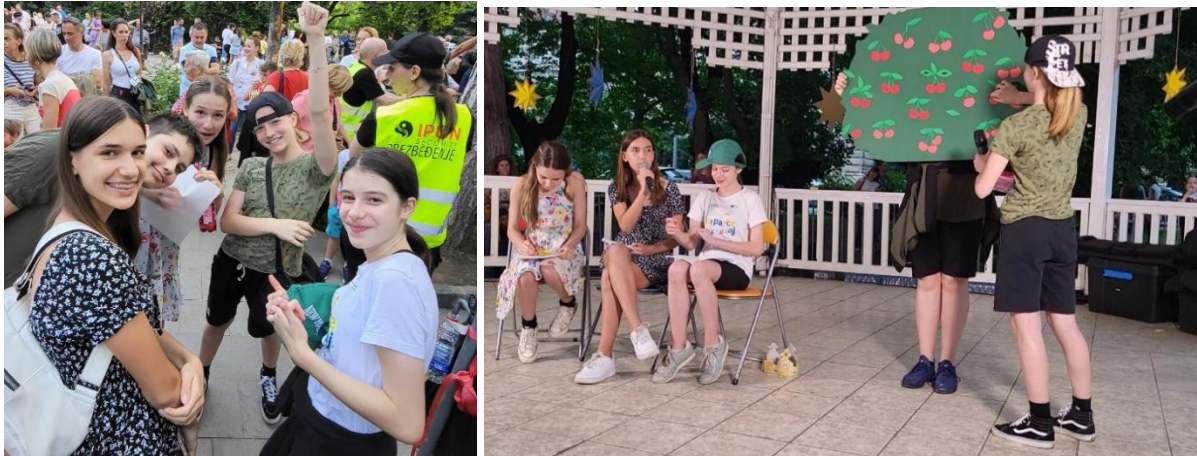
игроказ „Краљ трешиње“

10.06.2023. Змајеве дечје игре: Ученици четвог, петог и шестог разреда су учествовали по други пут у програму „Стихови у шетњи“. Наши ђаци су рецитовали песме наших познатих књижевника. Шетали су Дунавским парком и ужим центром града, као и пасажима који носе имена музичара Милана Младеновића и Владе Дивљана, где су се упознали и са рок поезијом.