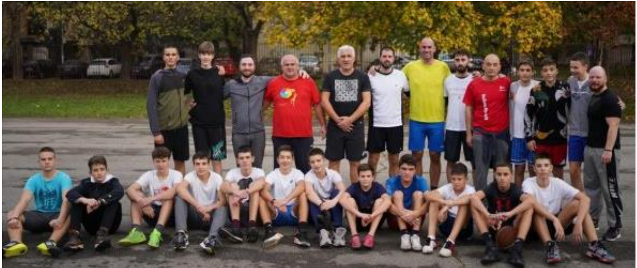
Хуманитарна утакмица: ученици- против наставника

окупила ученике и запослене који су учествовали или присуствовали фудбалској и кошаркашкој утакмици где су снаге одмерили ученици против наставника.