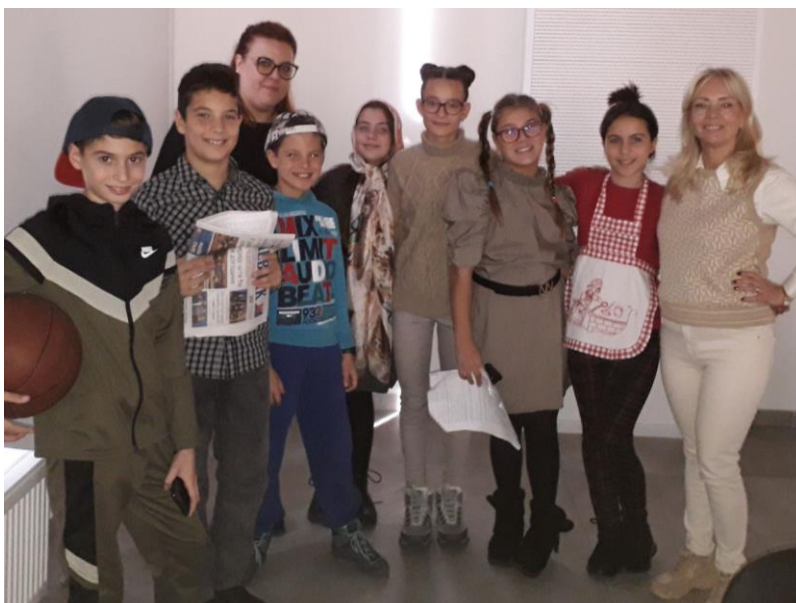
Фестивал “Позорница младима“