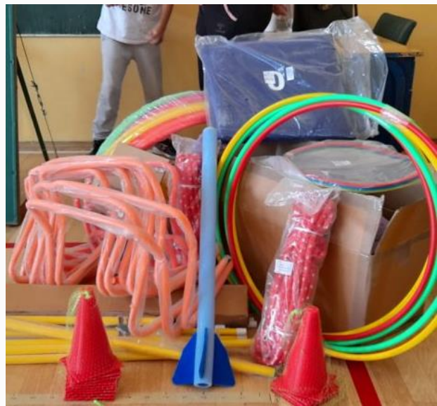
Уручење награда за најбоље резултате у школском спорту