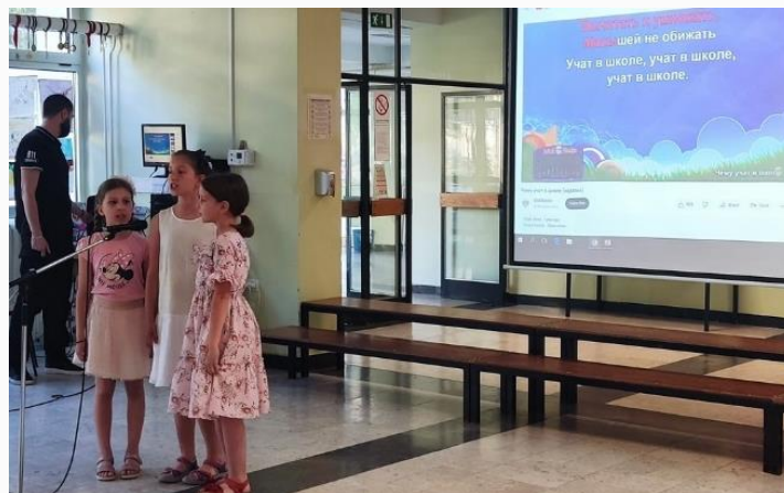
Дан руско-српског пријатељства

22.06.2023. У холу школе одржана је мала културна свечаност са циљем да се обележи дан руско-српског пријатељства. Ђаци су показали своја умећа у рецитовању и певању, а одржана је кратка презентација о нашој школи и изучавању руског језика и руске културе. Учесници програма били су ученици трећег, четвртог, шестог и осмог разреда (Ина Гавриловић).