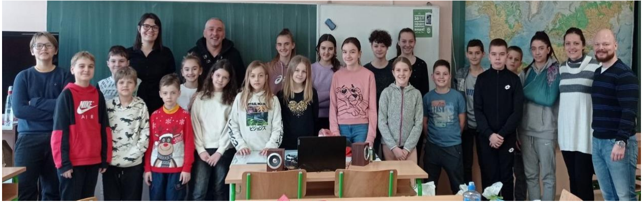
Дружење Вршњачког тима