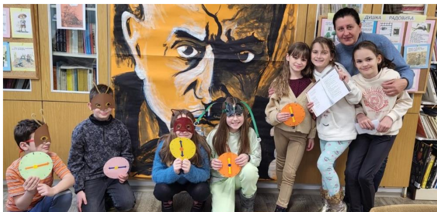
драматизација: „Мрав добра срца“