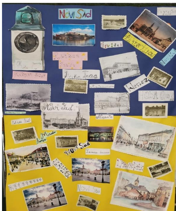
Изложба ученичких радова