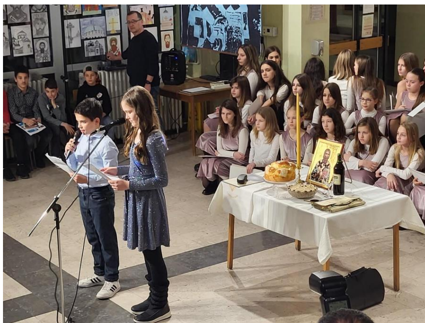
Прослава школске славе Светог Саве

Дан Светог Саве прослављен је и ове године свечаном академијом у Великој школи. Присуствовао је свештеник, кум школе, представници ученика, наставника и родитеља.