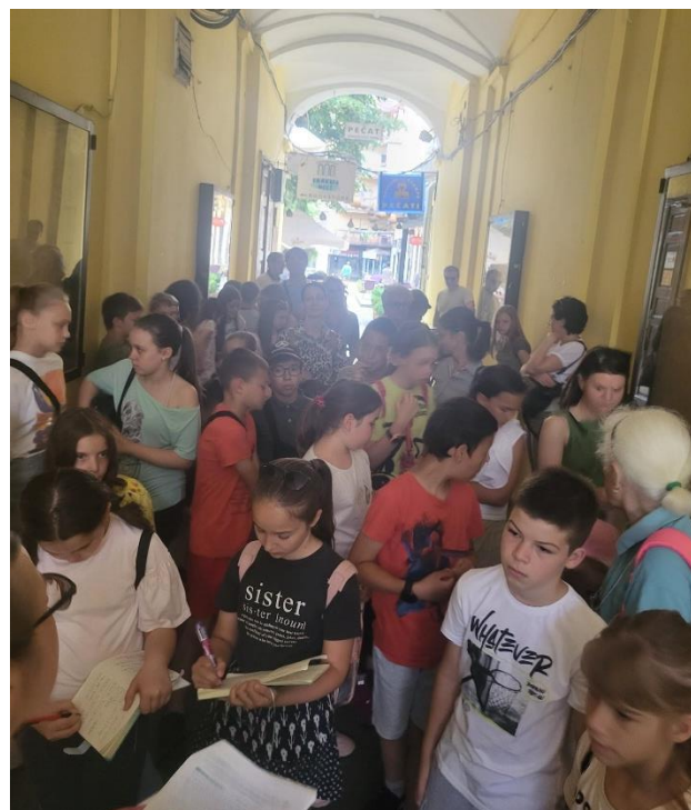
Змајеве дечје игре