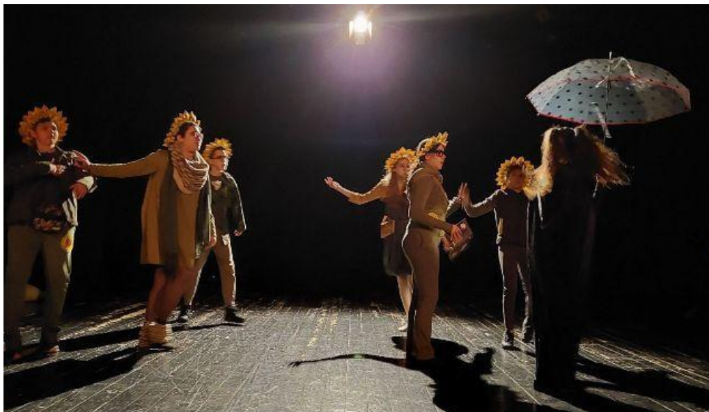
Представа "Као сунцокрет"