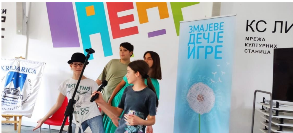
Змајеве дечје игре 2022.