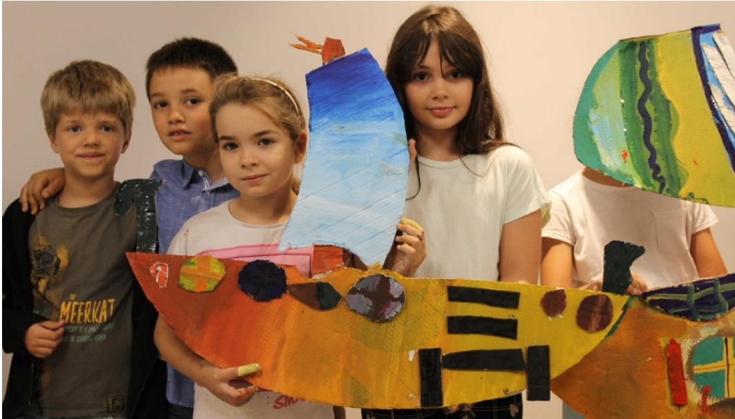
Ликовна едукативна радионица "Дунавске барке"