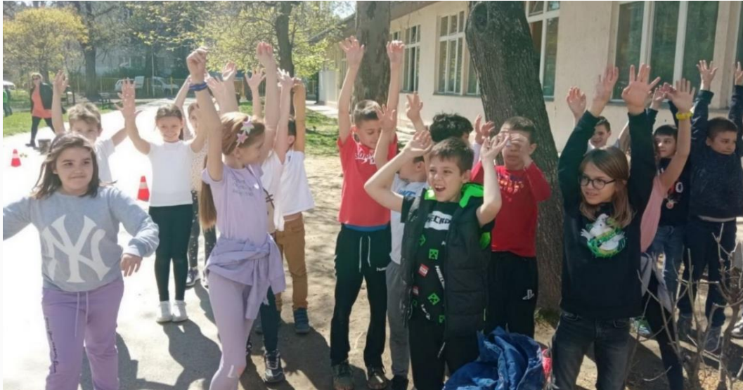
Ученици у продуженом боравку

13.04.2022. обележен је Светски дан космонаутике