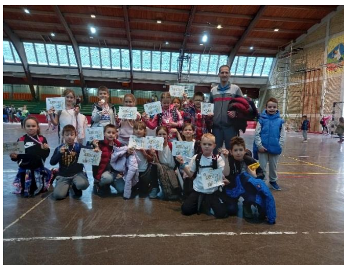
Мале олимпијске игре

12.04.2022. Турнир под називом „У сусрет пролећном распусту“ одржан је у организацији наставника продуженог боравка наше школе. На турниру су учествовали ученици 1. и 2. разреда. Своје вештине су показали кроз три дисциплине: између две ватре, прескакање вијаче и полигон спретности. Дан је протекао у пријатној атмосфери, а ученици су се радовали освојеним местима.