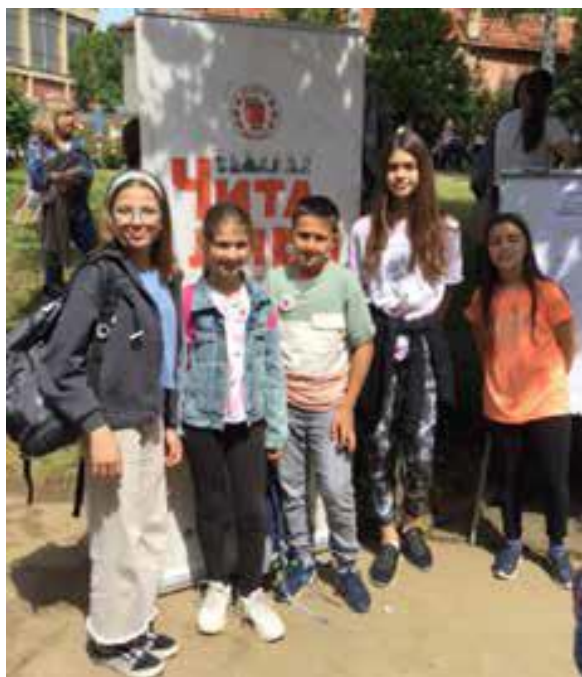
Републичко такмичење Читалићи