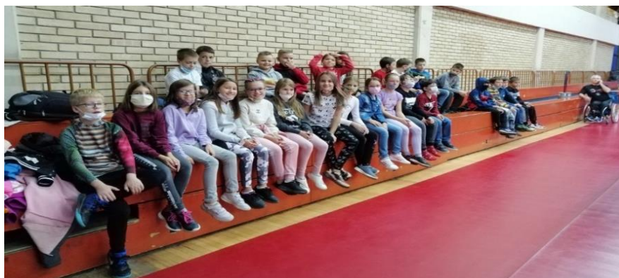
Презентацији школе стоног тениса на СПЕНС-у.