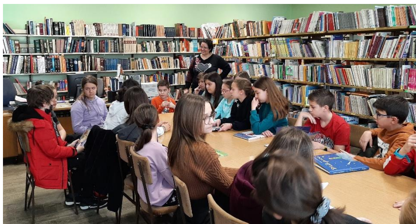
У сусрет Светском дану књиге- час у школској библиотеци

12.04. 2022. Предшколци из вртића "Мрвица" су посетили нашу школу са циљем упознавања са школом и активностима које се спроводе у њој. Ученици другог разреда су извели пригодан програм за предшколце.