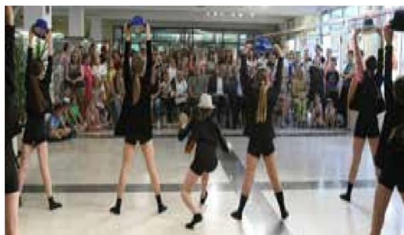
Прослава Дана школе

27.05.2022. Спортске игре младих у Новом Саду одржане су на Тргу слободе. Ученици другог разреда такмичили су се у трчању на 60 m и игри „између две ватре“.