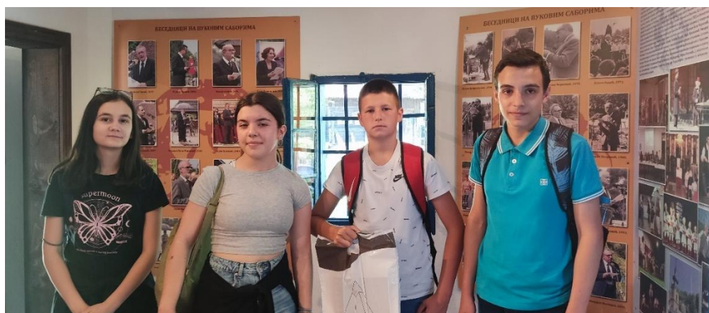
Републичко такмичење из српског језика-Тршић