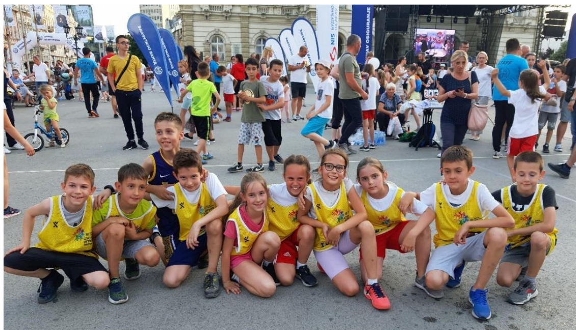
Спортске игре младих- освојено прво и друго место

27.05.2022. Спортске игре младих у Новом Саду одржане су на Тргу слободе. Ученици другог разреда такмичили су се у трчању на 60 m и игри „између две ватре“.