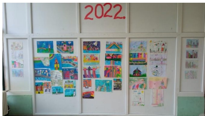
Изложба "Нови Сад кроз калеидоскоп"

Ученици другог разреда су направили изложбу ликовних радова у Малој школи на тему "Нови Сад кроз калеидоскоп".