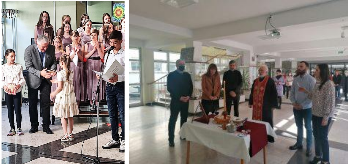
Прослава школске славе Светог Саве