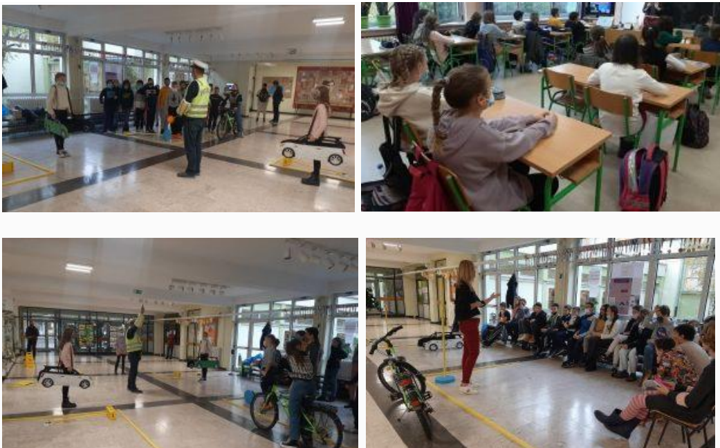
Тренинг безбедне вожње бициклиста

5.11.2021. У оквиру пројекта „Тренинг безбедне вожње бициклиста“, који спроводи Агенција за безбедност саобраћаја Републике Србије, у нашој школи је одржана едукација ученика петих разреда. Обука се састојала из теоријског и практичног дела.