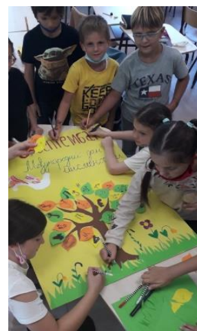
Ученици једносменске наставе

11.09.2022. Спортски дан за ученике 8. разреда одржан је на отвореним теренима наше школе, у организацији наставница физичке културе.