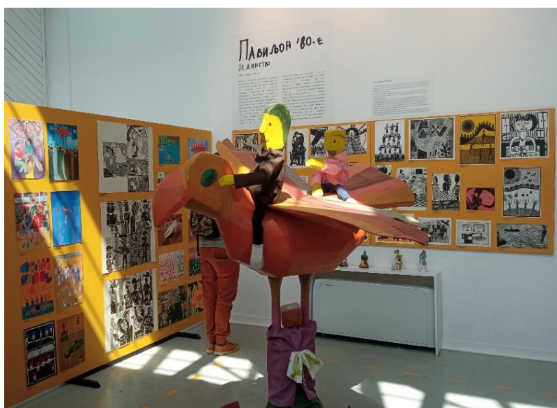
"Цртежи путују временом"

10.05.2022. Ученици другог разреда су ишли на изложбу "Цртежи путују временом", избор из колекције Центра ликовне културе деце и омладине од 1954. до 2019. године. Локација: Креативни дистрикт "Радионица".