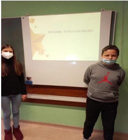
Предавање „Петарде - играј се безбедно“

17.12.2021. Ученици 8. разреда су, са својим млађим другарима, одржали предавање под називом „Петарде - играј се безбедно“. Указали су на опасност коју носи бацање петарди, како за децу, тако и за кућне љубимце. Пројекат је покренуо Бачки парламент. Предавање су одржали ученици 8-3 одељења.