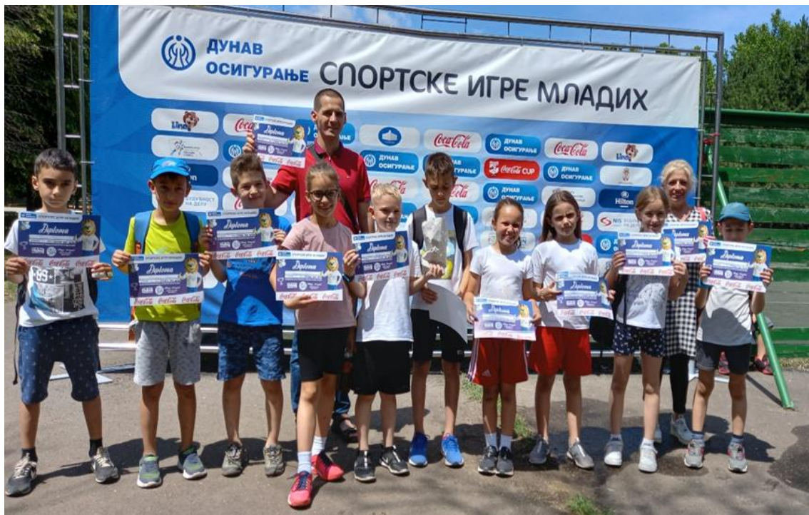
„Спортске игре младих“

17.06.2022. Регионално такмичење „Спортске игре младих“ Кикинда: Ученици наше школе су освојили треће место у игри „Између две ватре“.