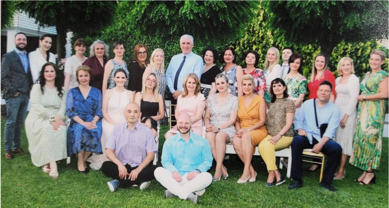
Прослава мале матуре, наставници

13.06.2022. Прослава мале матуре за ученике 8. разреда организована је у ресторану Exclusive NS на Новом насељу.