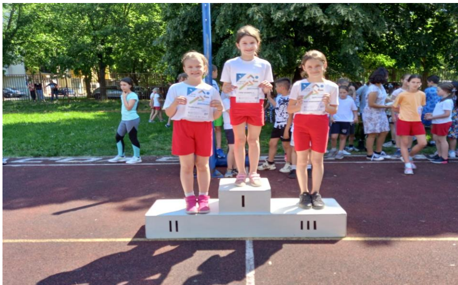
Крос, победничко постолје

15.05.2022. Град Нови Сад „Престоница европске културе“ и Основна школа „Јован Поповић“ имали су част да ове школске године угосте најуспешније младе такмичаре из историје на државном такмичењу. Такмичење су