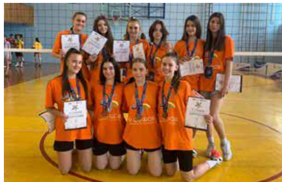
Наше успешне одбојкашице