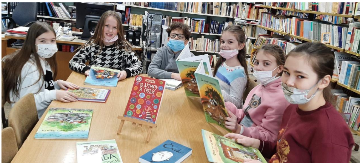
Светски Дан читања наглас