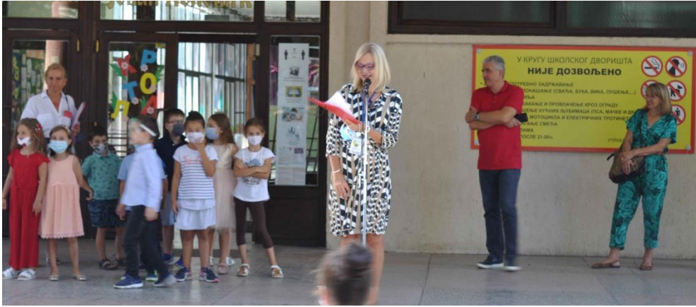
Учитељице на пријему првака