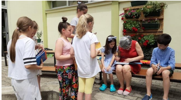
Дружење са књижевницом после сусрета и потписивање књига