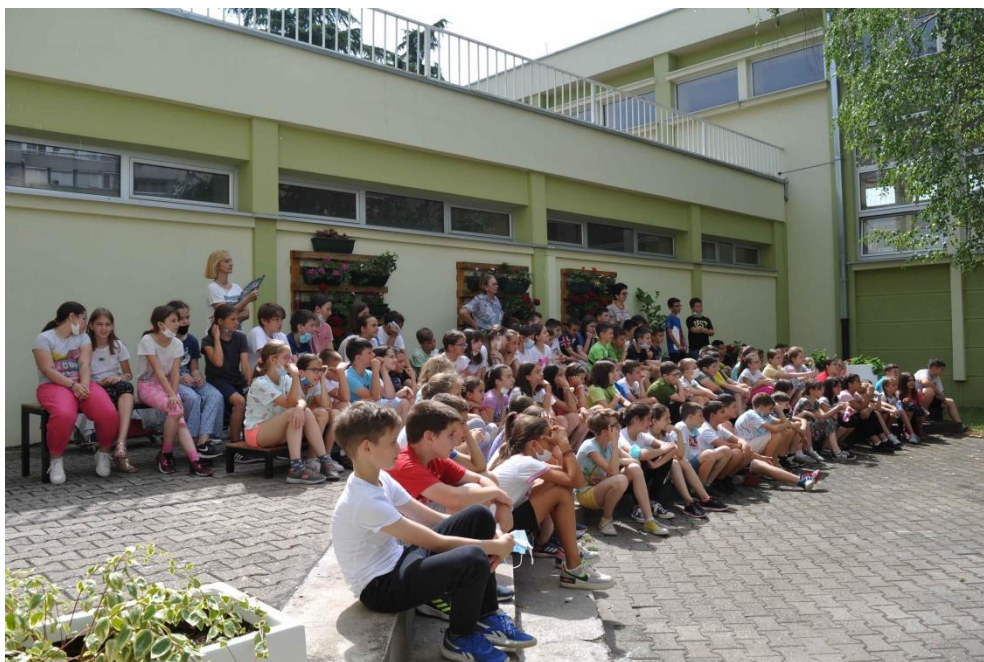
Завршна приредба у школском атријуму