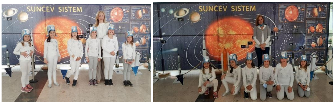
Изложба о свемиру