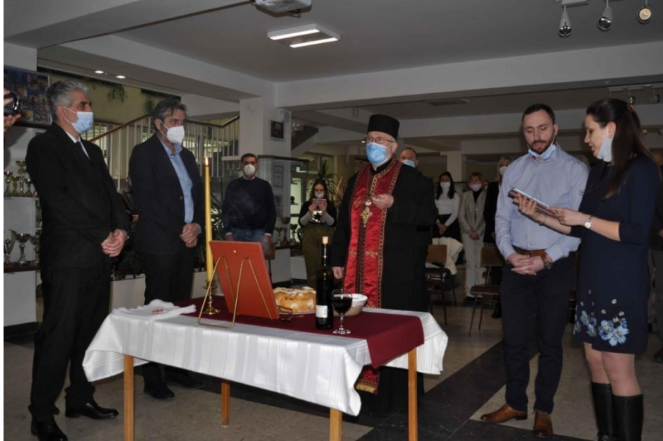
сечење славског колача

У нашој школи је 27. јануара одржано традиционално сечење славског колача, са ограниченим бројем присутних гостију.