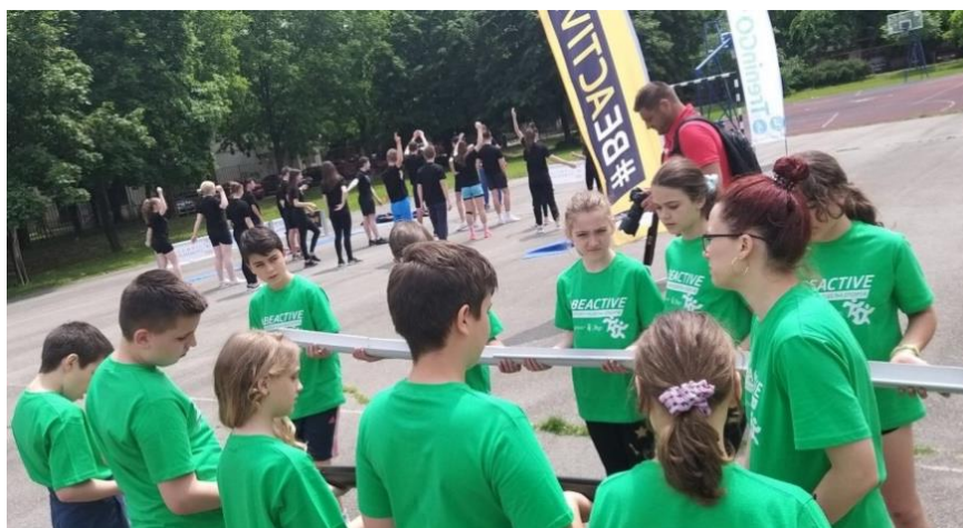
„TreninGo“ – Трчим за школу