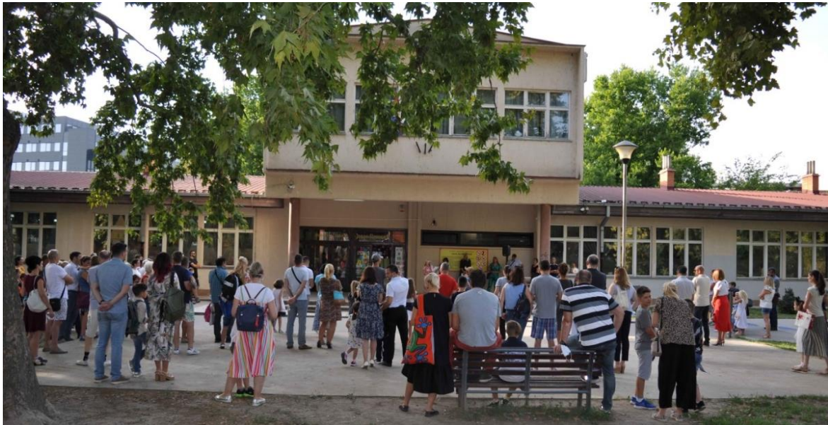
Пријем првака је приређен у дворишту Мале школе, за свако одељење посебно