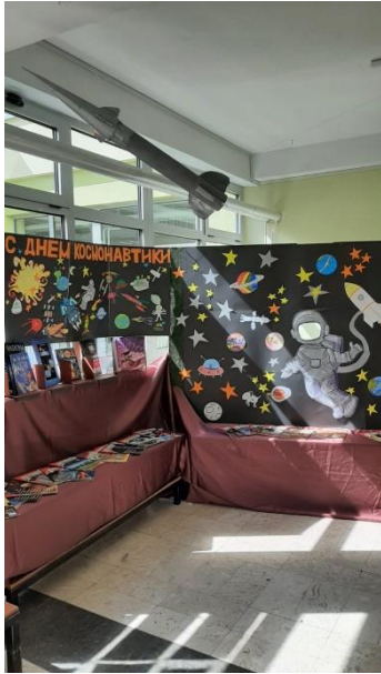
Изложба о Свемиру постављена је у два школска хола