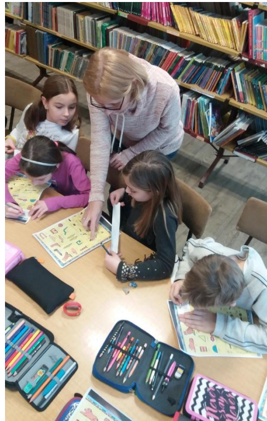
радна атмосфера у библиотеци