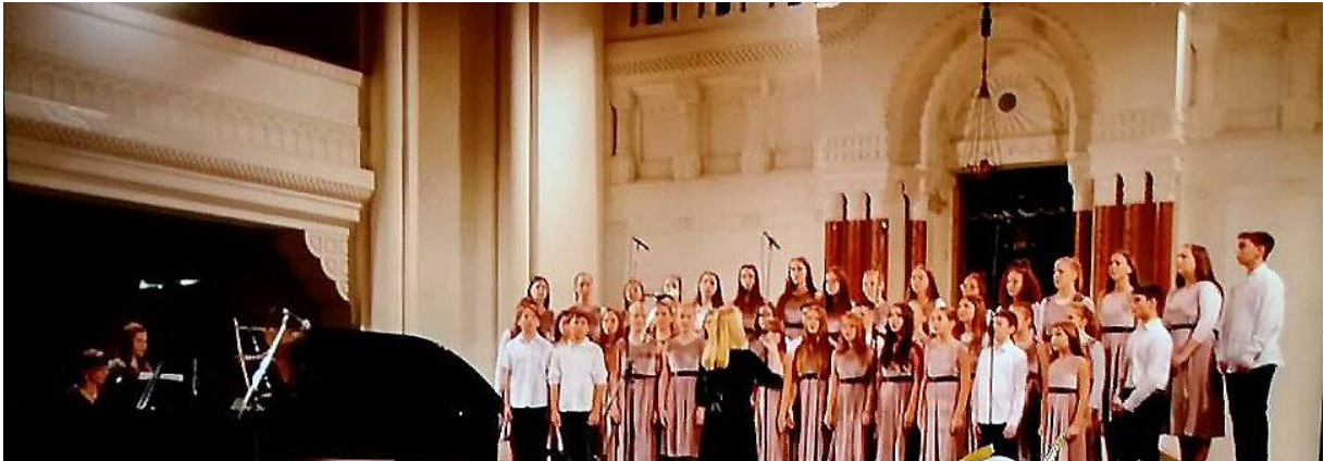
концерт најбољих хорова

И ове године хор наше школе представљен је на билборду у оквиру пројекта Учим + знам = вредим.