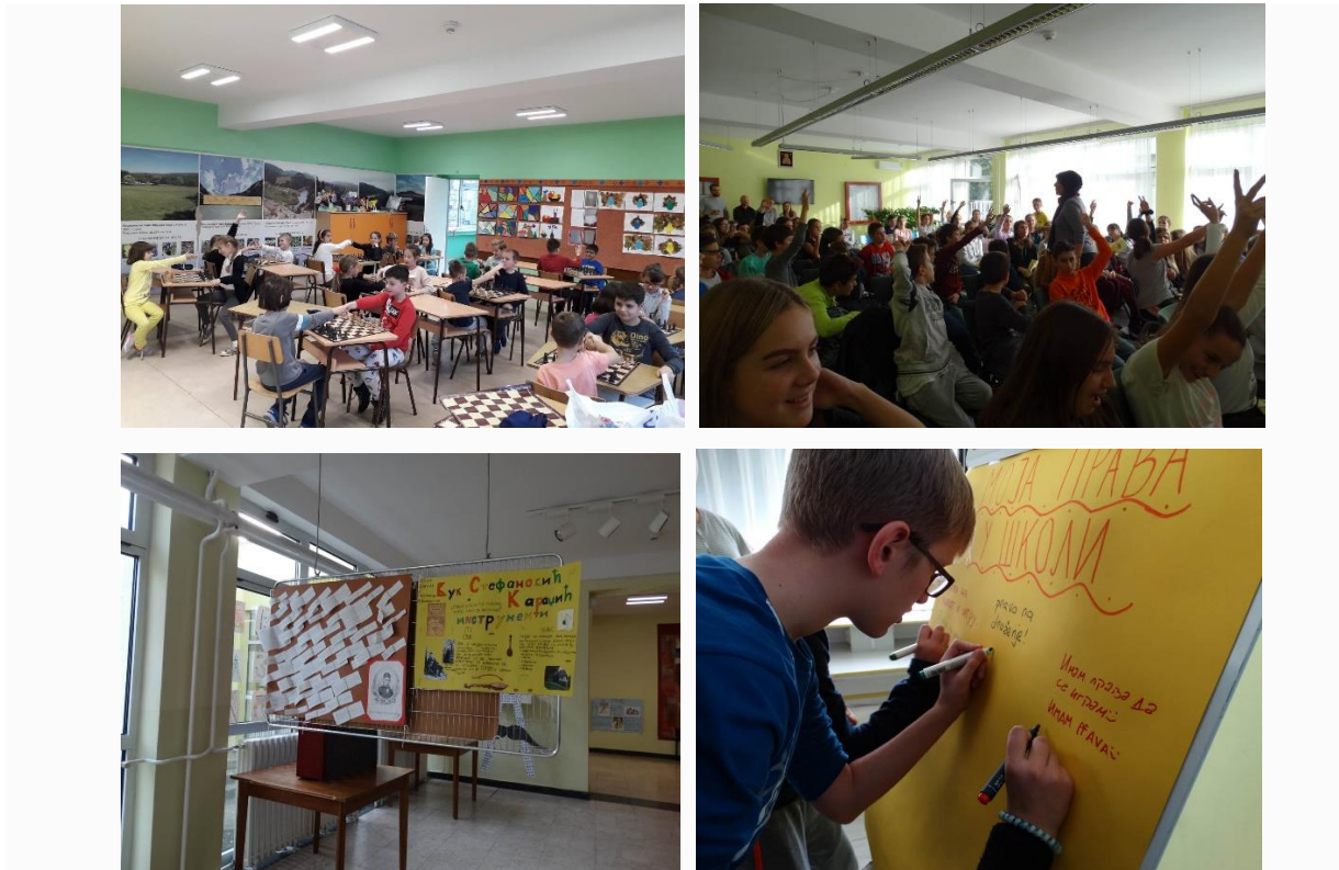
Фестивал дечијих права

26.11.2019. Завршен је Фестивал дечијих права на коме су учествовали ученици са својим наставницима („Квалитетно образовање за све“). Наша школа је у част обележавања 30 година од усвајања Конвенције о правима детета, била део Фестивала дечијих права, који се на иницијативу Покрајинског заштитника грађана, омбудсмана организовао на нивоу АП Војводине са темом Квалитетно образовање за све. Организоване су многобројне активности у којима су учесници били наши млађи и старији ученици. О свим овим активностима сведоче и фотографије у прилогу.