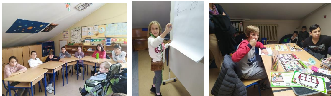
радионице у ШОСО Милан Петровић

19.11.2019. Ученици 4. разреда су присуствовали и активно учествовали у радионици у ШОСО „Милан Петровић“ где су научили како да креативно и слободно изразе и унапреде своје комуникацијске вештине.