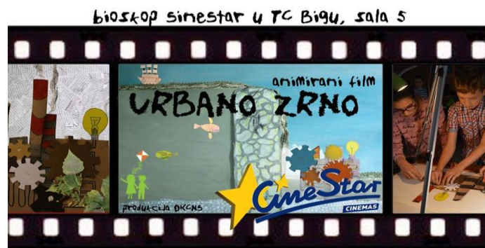
премијера филма → 28.11.2019 у 11 часова

28.11.2019. Премијера анимираног филма „Урбано зрно“ у чијој су изради учествовали и ученици IV-2 одељења одржана је у биоскопу у Биг центру.