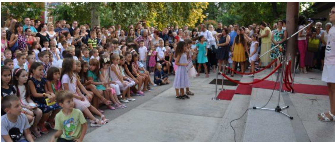
Свечани пријем ђака првака

У августу месецу изашао је из штампе 55. број школског часописа „Бачко перо“.