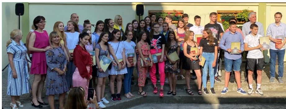
Свечана додела награда у атријуму школе