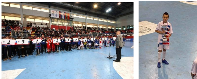
Куп града Новог Сада

2.02.2020. Наши ученици су учествовали на Купу града Новог Сада;